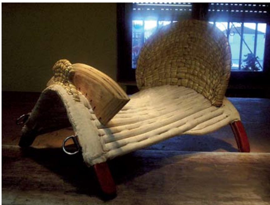
A la derecha, montureros

clavada en una montura vaquera, a parte de ser una forma más de estropear una montura, es inservible ya que las barras de la horquilla nos impiden llevar las rodillas donde hay que llevarlas y nos obliga a montar con las piernas rectas y las punteras hacia abajo, y en esa postura ni se hace equitación, ni el borrén hace efecto, así lo único que conseguimos es darle barrigazos.