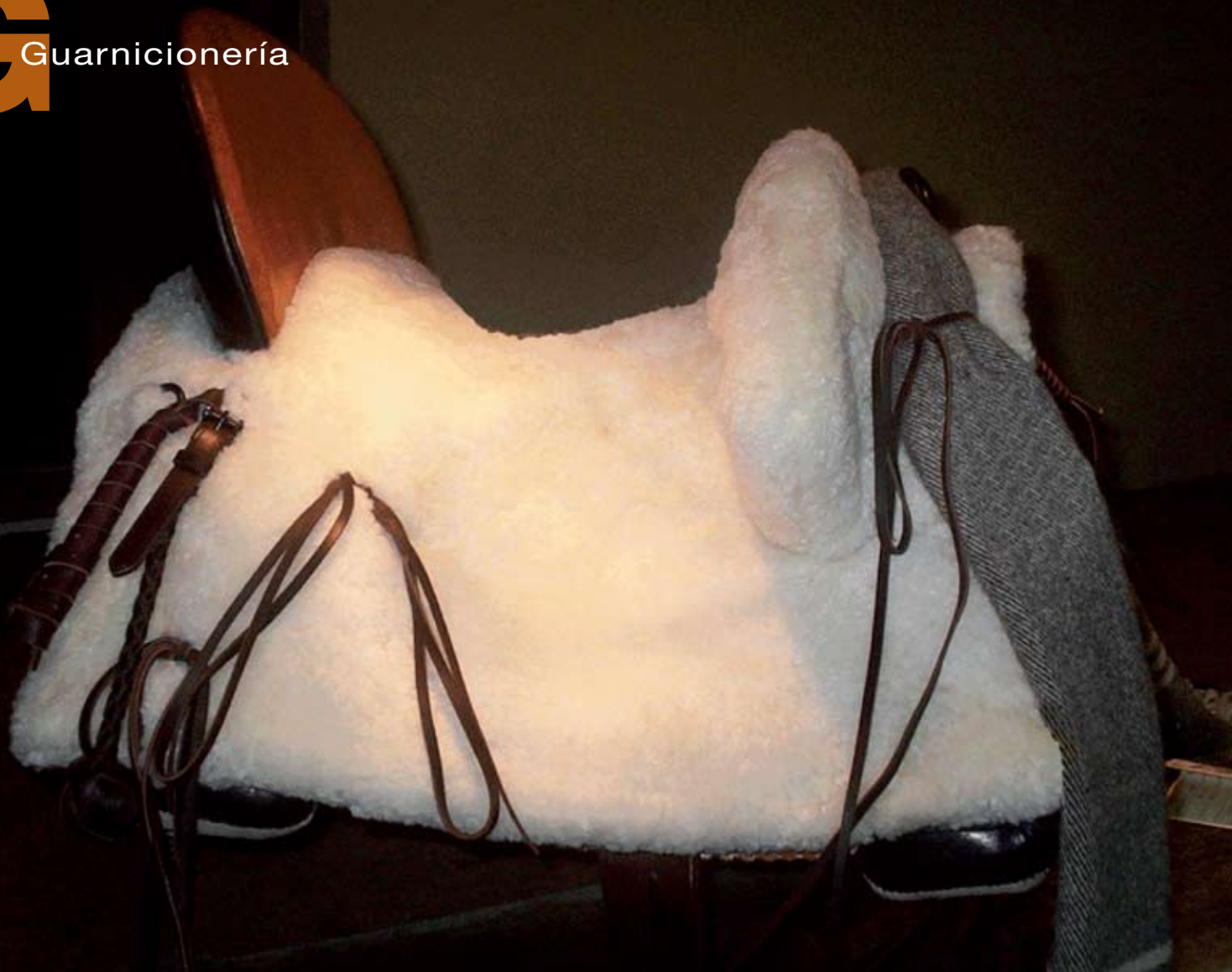
A la derecha, montureros